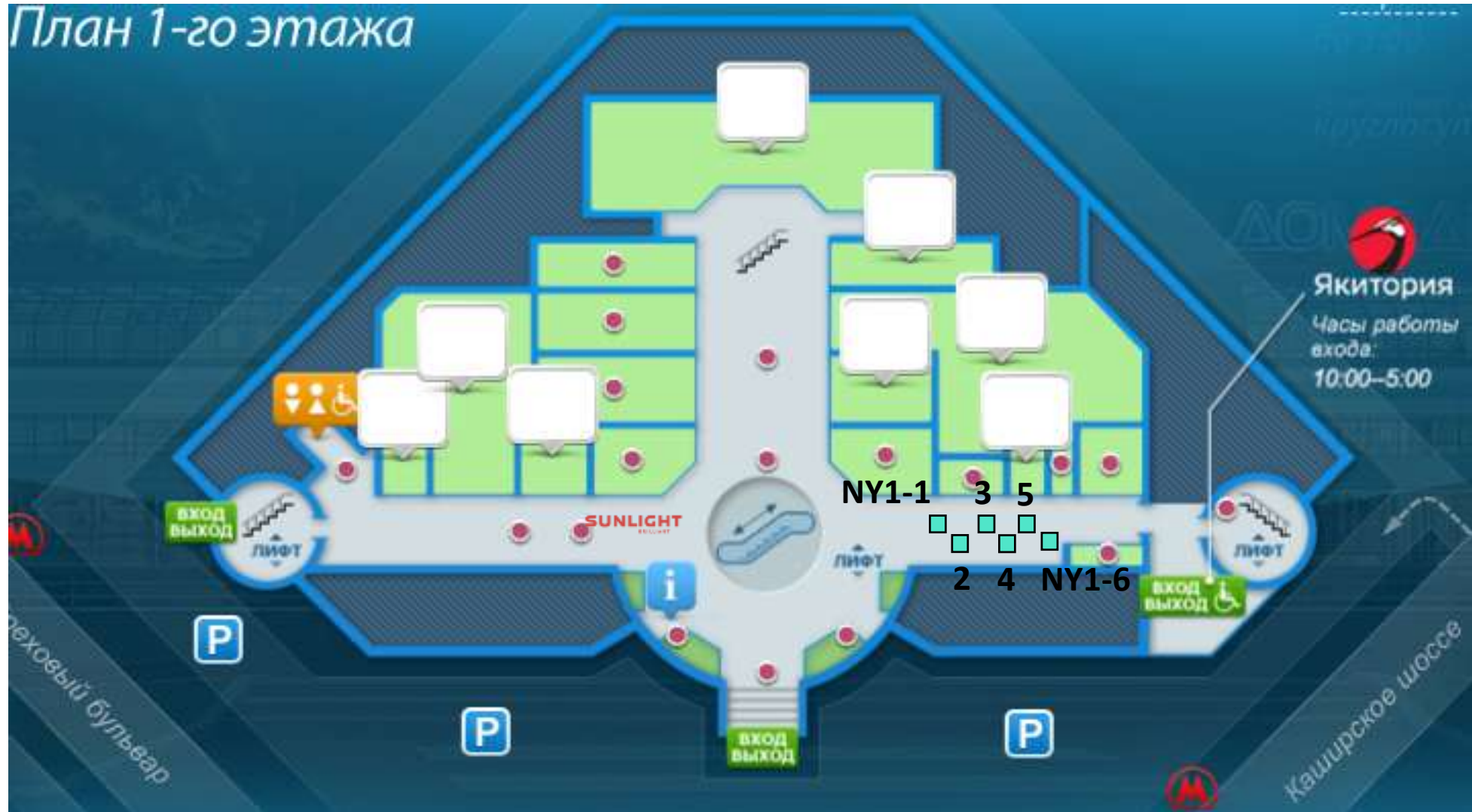
План 1-го этажа